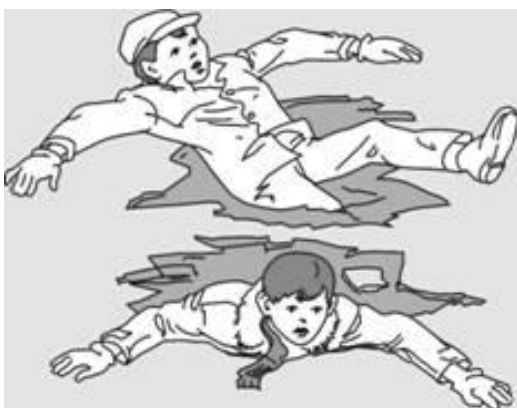
Попытки вылезти самому из полыньи грудью или спиной

Если вы провалились под лед, широко раскиньте руки, навалитесь грудью или спиной на лед и постарайтесь вылезти на него самостоятельно, зовите на помощь.