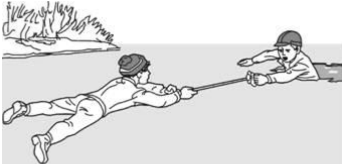
Помощь лыжной палкой

ложатся на лед и цепочкой продвигаются к пострадавшему, удерживая друг друга за ноги, а первый подает пострадавшему лыжные палки, шарф, одежду и т. д. Деревянные предметы (лестницы, жерди, доски и др.) необходимо толкать по льду осторожно, чтобы не ударить пострадавшего. Спасатель при этом должен обезопасить и себя. Продвигаясь к пострадавшему, следует лечь на доску, лыжи и другие предметы.