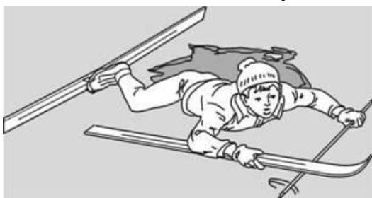
Попытки вылезти самому из полыньи с лыжами

Провалившемуся необходимо внушить, чтобы он широко раскинул руки на льду и ждал помощи, так как самостоятельная попытка вылезти из воды может привести к новому обламыванию кромки льда и очередному погружению пострадавшего под лед.